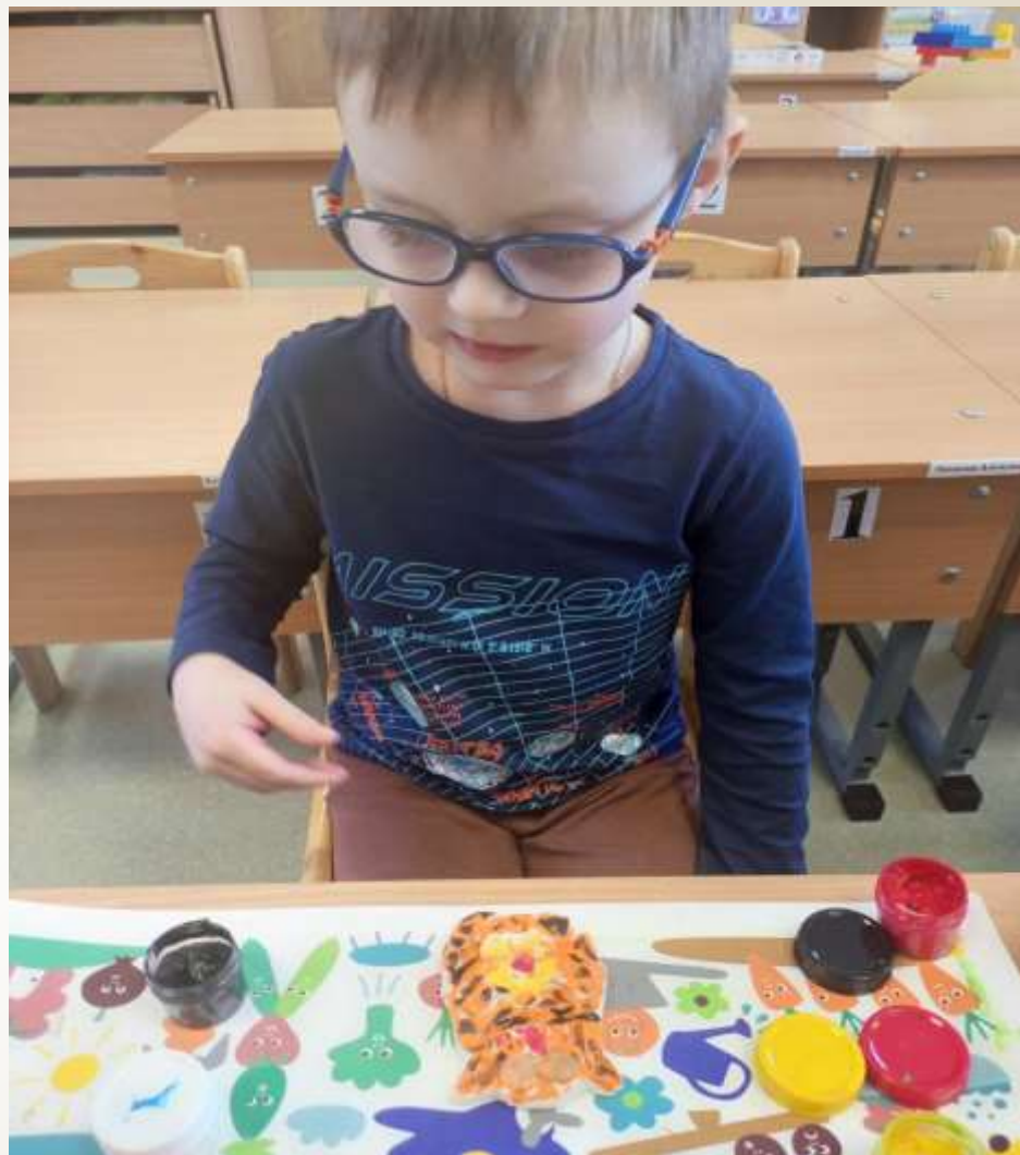
«Приготовление теста из соли»